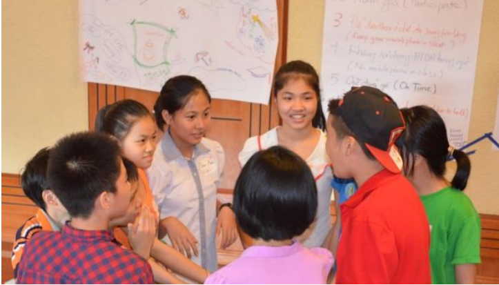
Con tôi đã trưởng thành hơn rất nhiều

Trong cuộc sống hôm nay, nhu cầu được tiếp cận với các thông tin đúng và chính xác về giới tính, sức khỏe sinh sản của lứa tuổi vị thành niên là rất lớn bởi đây là lứa tuổi có sự thay đổi về tâm sinh lý rất đặc trưng. Phần lớn các bạn nam và nữ dậy thì ở giai đoạn lứa tuổi này, nhu cầu, tâm lý tò mò, muốn khám phá bản thân và người khác giới rất cao.