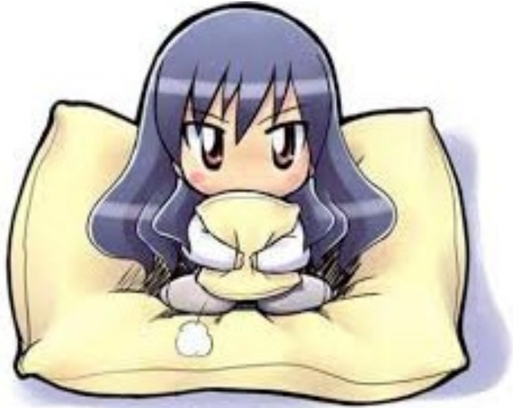
Mình đang gặp rắc rối

Mình là một cô bé khá tinh nghịch và ham chơi. Bạn bè thường gọi mình là “mặt còi” vì mình có làn da “bánh mật” và trông mình cũng nhỏ hơn các bạn khác trong lớp. Một thói quen không tốt của mình là mình rất ít khi để ý đến sức khỏe của mình. Mẹ thường hay nhắc nhở nhưng mình chẳng khi mấy khi bận tâm, chỉ đến khi bị ốm nằm nhà hay phải đi bệnh viện mình mới chịu ngoan ngoãn hơn. Thế nhưng, có một chuyện đã xảy ra và kể từ thời điểm đó trở đi mình mới biết yêu quý bản thân mình hơn.