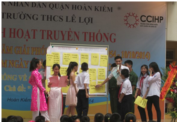
Trò chơi “Lựa chọn đúng”

“Buổi truyền thông rất bổ ích, giúp em hiểu hơn về sự phát triển cơ thể của mình khi ở tuổi dậy thì và biết thêm về các biện pháp tránh thai” ( Học sinh lớp 7 trường THCS Lê Lợi )